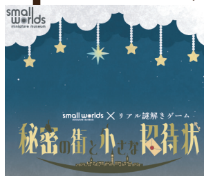
small worlds 様