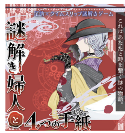
足助中央商店街様