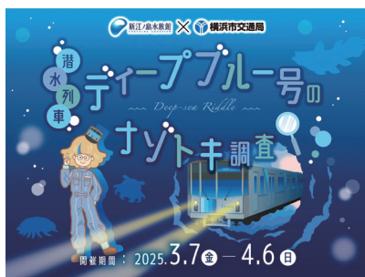
新江ノ島水族館様 × 横浜市営地下鉄様