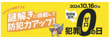
世田谷区交通安全課様

*「阪神電車様」「京阪電車様」については、 謎解き会社『フラップゼロアルファ様』の企画で 一部制作を担当した事例です。