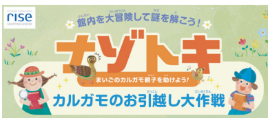
二子玉川 rise 様