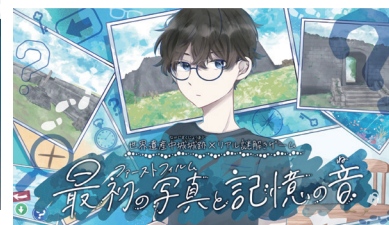
世界遺産中城城跡様