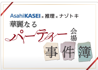
旭化成株式会社様